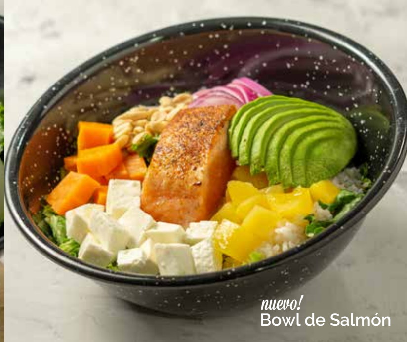
nuevo! Bowl de Salmon