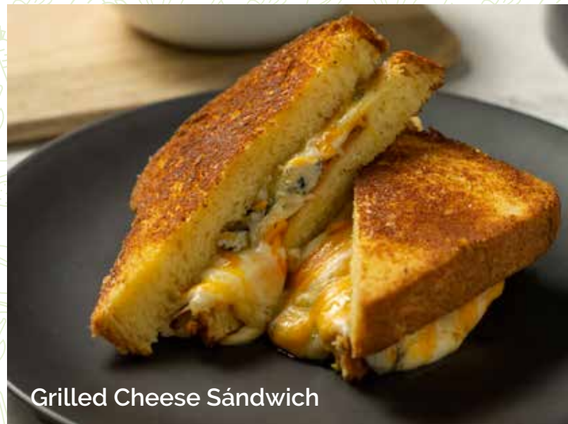
Grilled Cheese Sándwich