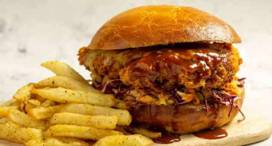
Sándwich de Pollo Frito