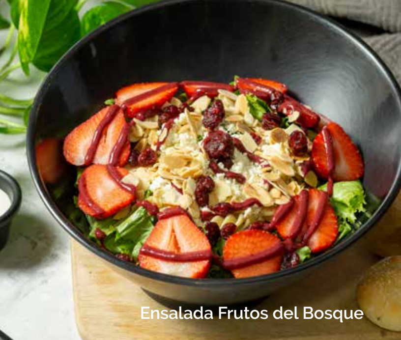
Ensalada Frutos del Bosque