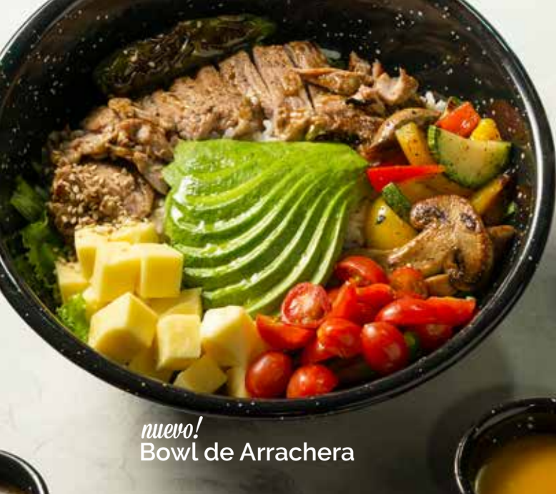
nuevo! Bowl de Arrachera