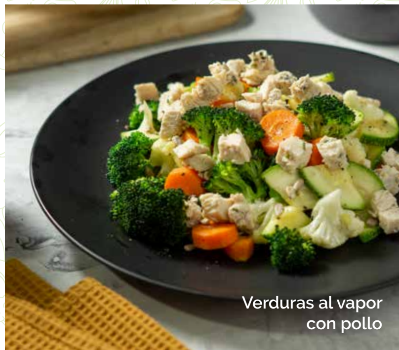
Verduras al vapor con pollo

César, Ranch, Miel Mostaza, Blue Cheese, Vinagreta Balsámica, Cilantro